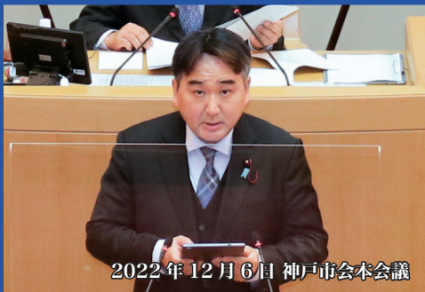
2022年12月6日 神戸市会本会議