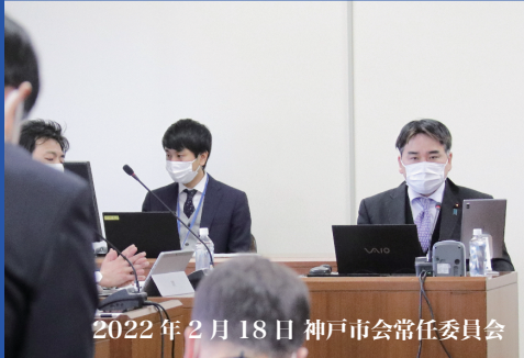
2022年2月18日 神戸市会常任委員会