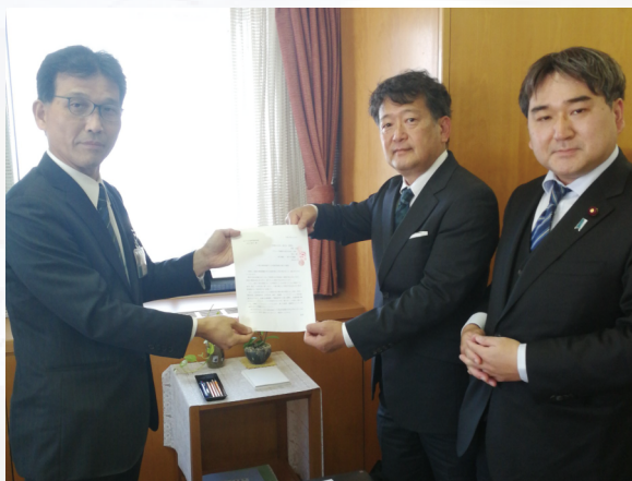
4月、市交通局副局長に小東台住民の要望を提出

神戸市民の尊い命がこれ以上脅かされることを、道路管理者である市政としても見過ごしてはなりません。私の政治生命を賭して、この小東台地域の住民の安全を守って参りたいと思います。今後も地域の皆様のニーズを細かく把握し、逐次、当局へ橋渡しをして参りたいと思います。お気づきのことがありましたら、お気軽に私の携帯 090-9259-1555 までご相談下さい。