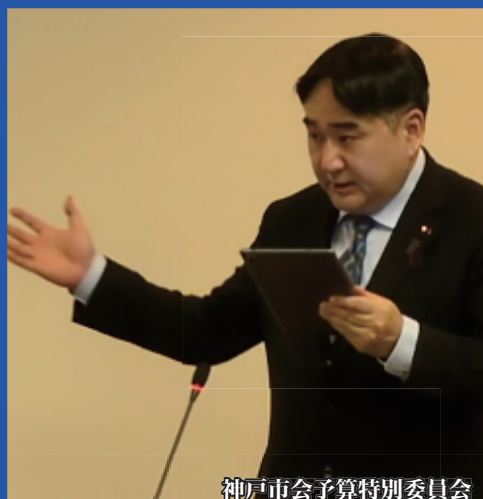
神戸市会予算特別委員会

発行：新しい自民党神戸市会議員団 神戸市中央区加納町 6-5-1 TEL090-9259-1555