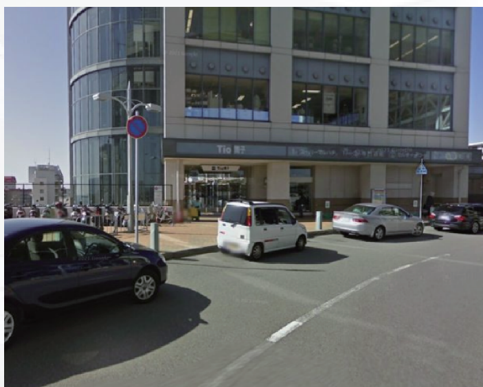
違法駐車が常態化し、障がい者・高齢者等の送迎車が寄りつけなかったティオ舞子前ターミナル

鋭意調整を進め、完成までこぎつけた、神戸市都市局と垂水建設事務所の皆様に、改めてこの場を借りて御礼申し上げます。