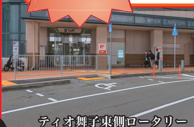
ティオ舞子東側ロータリー

車椅子や足の悪い高齢者など、移動に制約がある方々が、送迎車を降りてすぐティオ舞子・舞子駅に最短距離で入っていけるよう、障害者用プライオリティスペースを 新設！